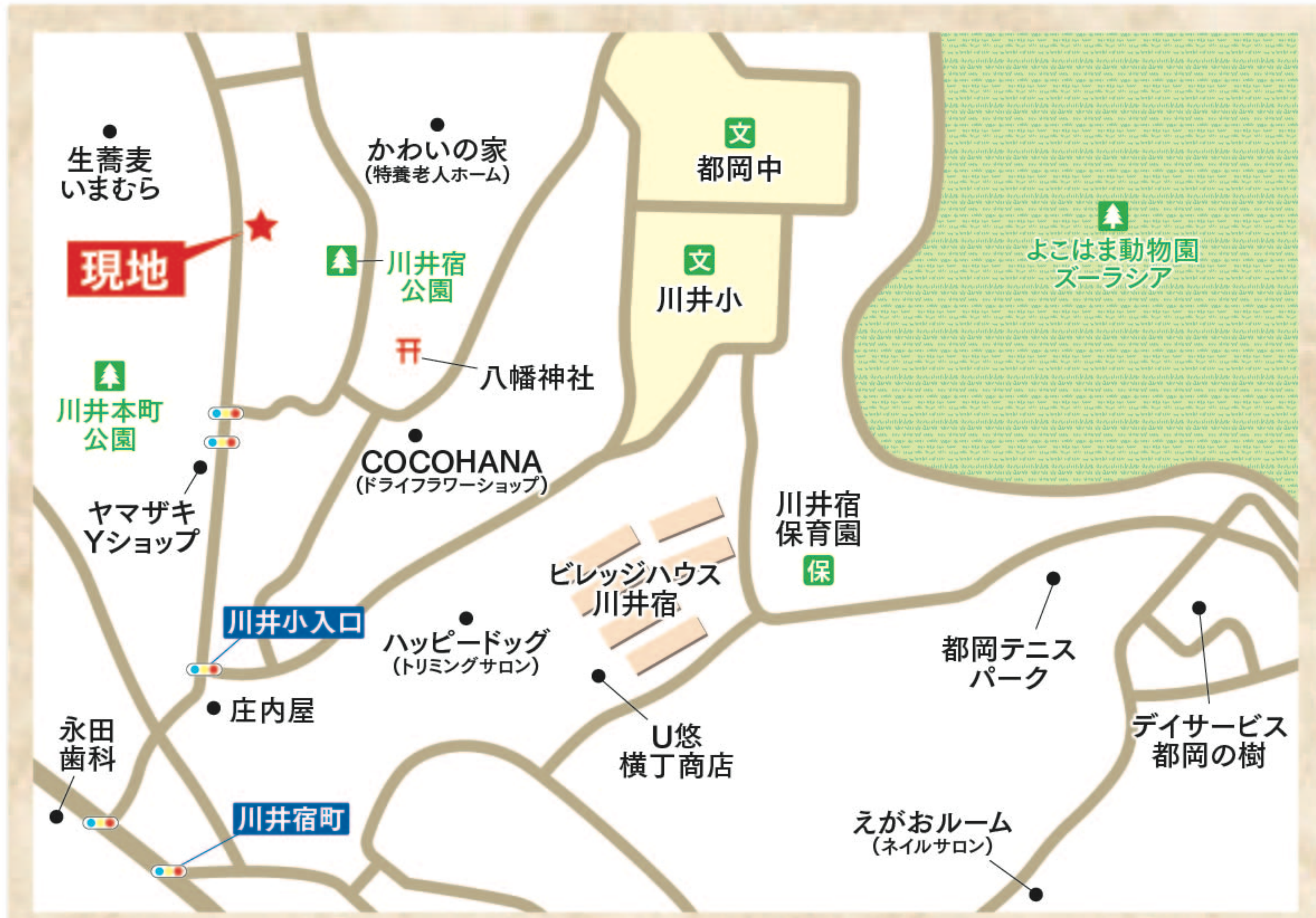
CAR NAVI 横浜市旭区川井宿町128-28 付近