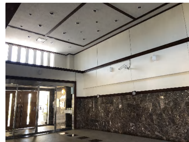
マンションエントランス