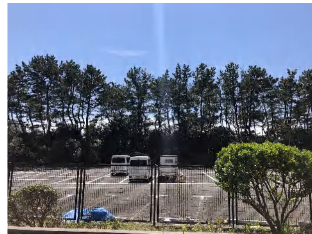
南側には建物はなく日当たり良好です