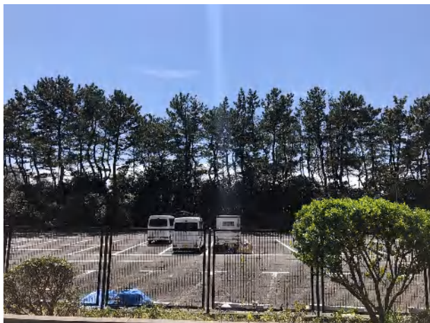
南側には建物はなく日当たり良好です